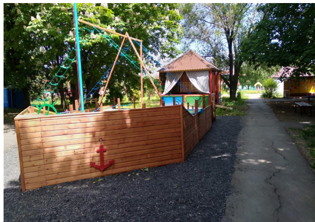
Малая архитектурная форма в виде корабля «Победа»

Веревоочный парк - это полоса препятствий, прохождение которой делает человека увереннее в себе, решительнее. Прохождение по веревочным трассам для детей с ограниченными возможностями здоровья и инвалидностью являются настоящим спортивным приключением, прежде всего потому что, кроме развития двигательных навыков, дети развивают коммуникативную активность. Большая часть испытаний на веревочной трассе командные и они учат доверять себе и другим, поддерживать, помогать, а также просить о помощи, когда нуждаешься в ней.