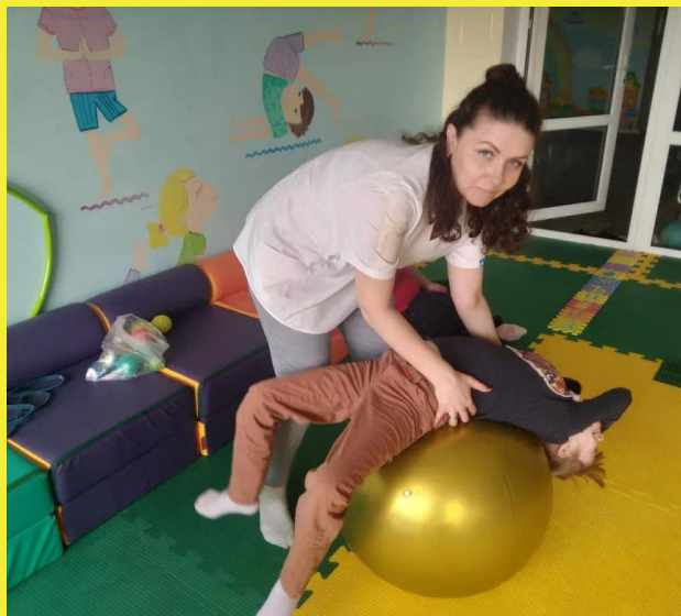
Автор Татьяна Новоселова, (Продолжение в следующем номере).

Режим проведения занятий: 2 раза в неделю полуторачасовые занятия с 2 перерывами по 15 минут.